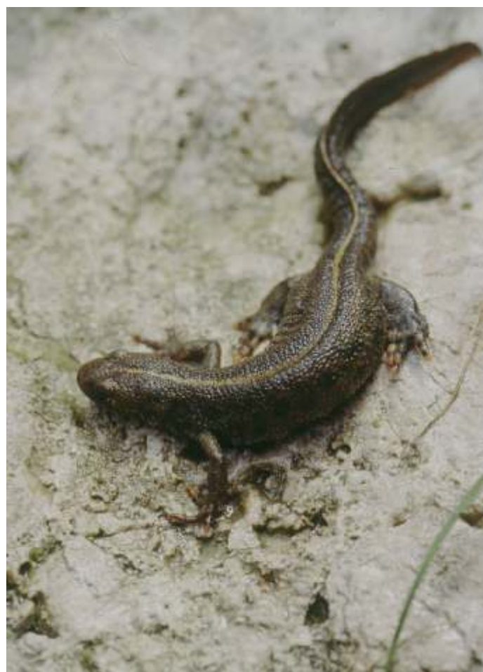
Slika 1: Samička velikega pupka ( Triturus carnifex ) v času spomladanskih selitev na mrestišča

Na Kraškem robu so habitati iz Habitatne direktive predvsem vsi suhi travniki in pašniki, ki jih tipologija označuje kot »vzhodna submediteranska suha travišča«. Na seznamu je tudi habitatni tip »sestoji navadnega brina na suhih traviščih na karbonatih«, kar pa pri nas pomeni le stopnjo zaraščanja travišča in vsaj nam ne pomeni posebno vredne oblike vegetacije, saj gre le za prehod iz travišča v pionirski gozd. Ponekod v Čičariji imamo tudi zaplate travnikov s prevladujočo stožko ( Molinia