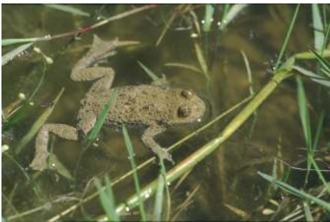
Slika 2: Hribski urh ( Bombina variegata ) je pogost prebivalec kalov

Za dvoživke je voda življenjskega pomena. V njej se razmnožujejo, vanjo odlagajo jajca, iz katerih se preko stadija ličinke razvijajo v odrasle živali.