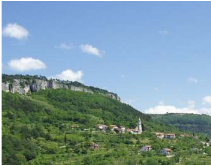
Kraški rob nad Črnim kalom